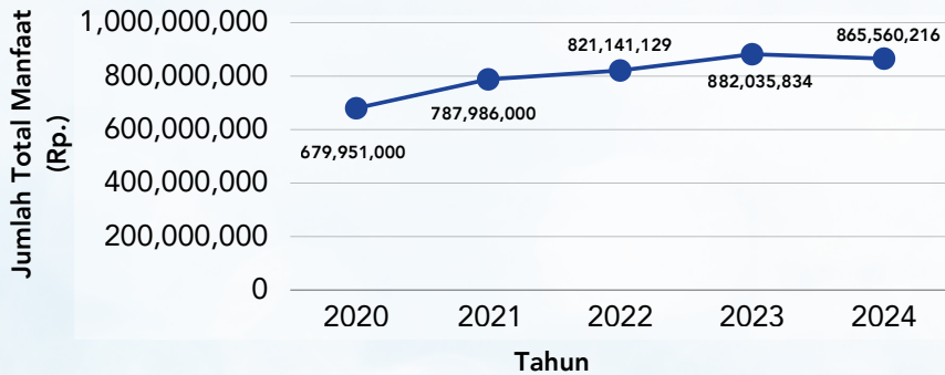
Manfaat Ekonomi 2020 - 2024

Pantai Peneluran Penyu Taman Pesisir Jeen Womom, Kabupaten Tambrauw, Papua Barat Daya Kampung Resye, Womom, Syukwo, Wau, dan Weyaf